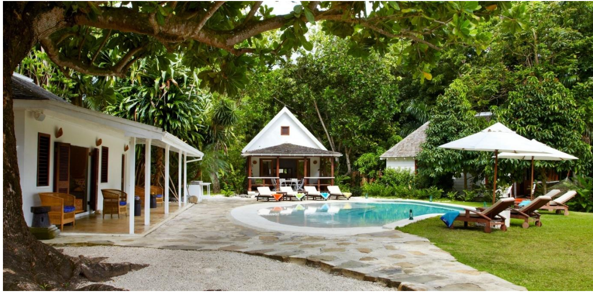
Figura 5. ( https://www.theflemingvilla.com/the-history/ data: 30.08.2019)