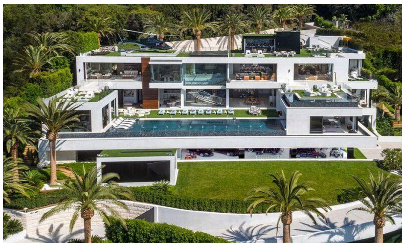
Figura 2. ( https://www.luxhabitat.ae/the-journal/top-10-most-luxurious-villas-world/ data: 30.08.2019)