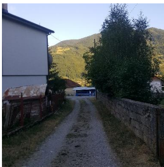
Figura 7. Foto e rruges (, data: 25.07.2019)