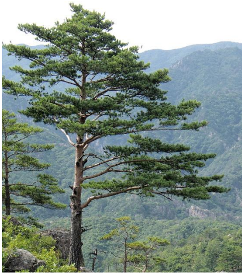
Figura 12. E marr nga Google ( 30.08.2019)

Dhe nga pishat, si element nxjerrim drurin