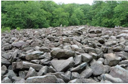
Figura 11. ( 30.08.2019)

Nga shkembinjte, si element nxjerrim gurin