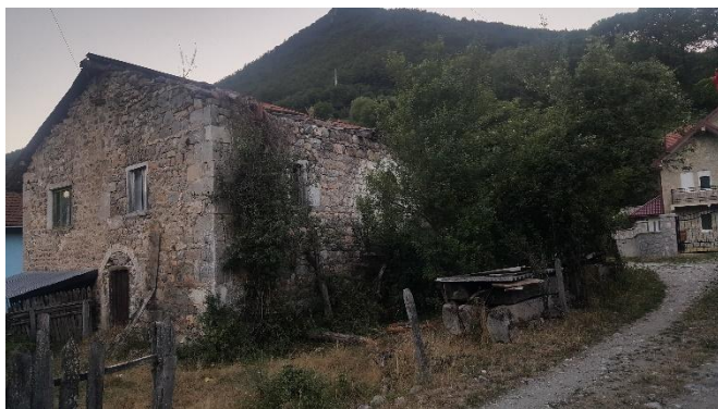
Figura 6. Foto e objektit