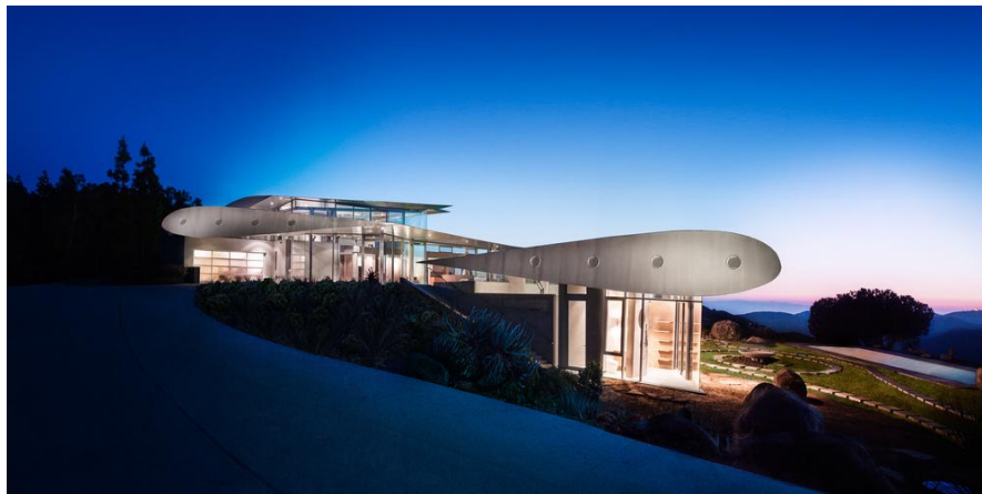
Figura 4. ( https://davidhertzfaia.com/747-wing-house data: 30.08.2019)