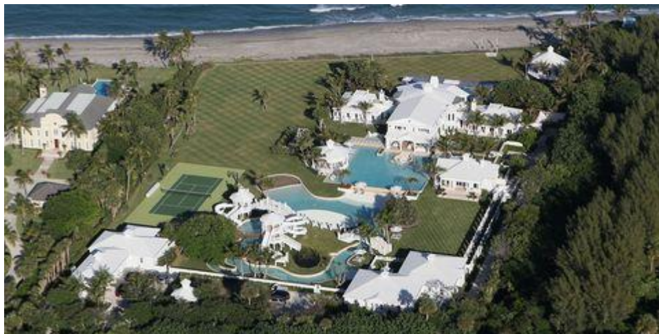
Figura 3. ( https://www.townandcountrymag.com/leisure/real-estate/g9573388/celine-dion-house/ data: 30.08.2019)