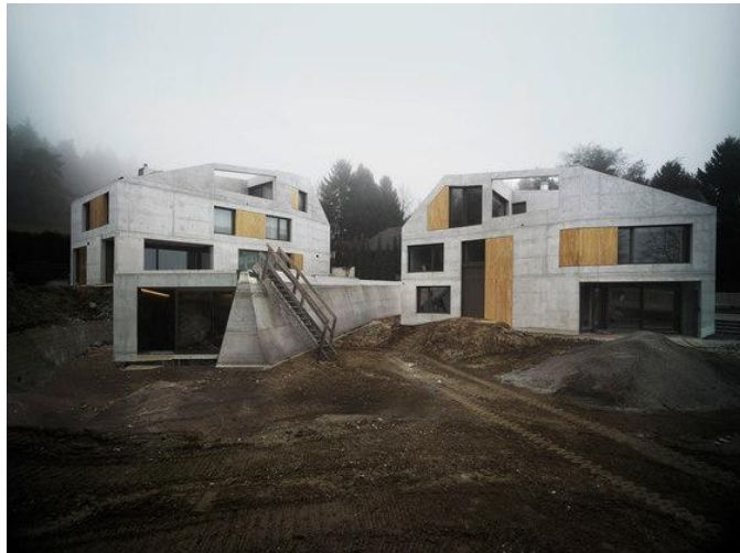
Figura 1. ( https://www.archdaily.com/784063/villa-ensemble-afgh data: 26.09.2019)